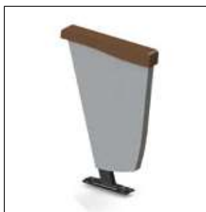
Forma de pata en Z para los fines de fila.