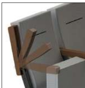
Acceso ADA garantizado, gracias a brazos abatibles.