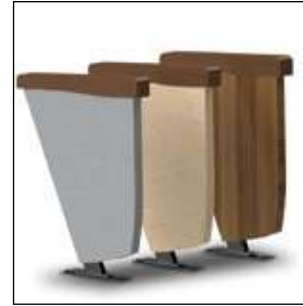
Un amplio rango de opciones para los fines de fila (tapizados, laminados y termolaminados).