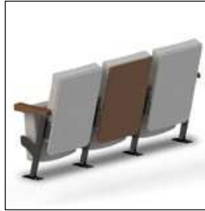
Cubiertas de espaldar y asiento tapizadas, laminadas o termolaminadas.