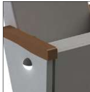
Una luz de pasillo puede agregarse para mejor orientación.