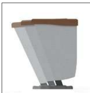
Pueden instalarse en suelos inclinados: desde 0 hasta 5 grados.