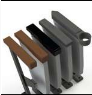
Diferentes formas y materiales de brazos disponibles.