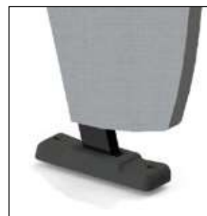
Una cubierta plastica que protege el anclaje al piso y mejora la estética.