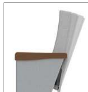
El espaldar puede inclinarse en tres posiciones, de 15°, 18° y 21°. El asiento puede abatirse a 90°.