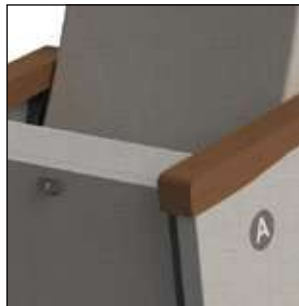
Marcadores de fila en los extremos y numeración por asiento.